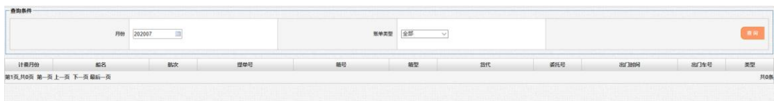
图 2.1-1 EDI 费用详单查询

如需查询计费相关业务数据，点击货代“货代集装箱费用明细”，“货代件杂货费用明细”按钮，进入”EDI 费用详单查询”页面，或可点击“导出 Excel”按钮导出费用详单：