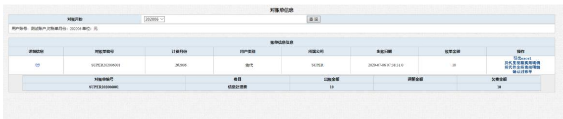
图 2.1-1 对账单明细